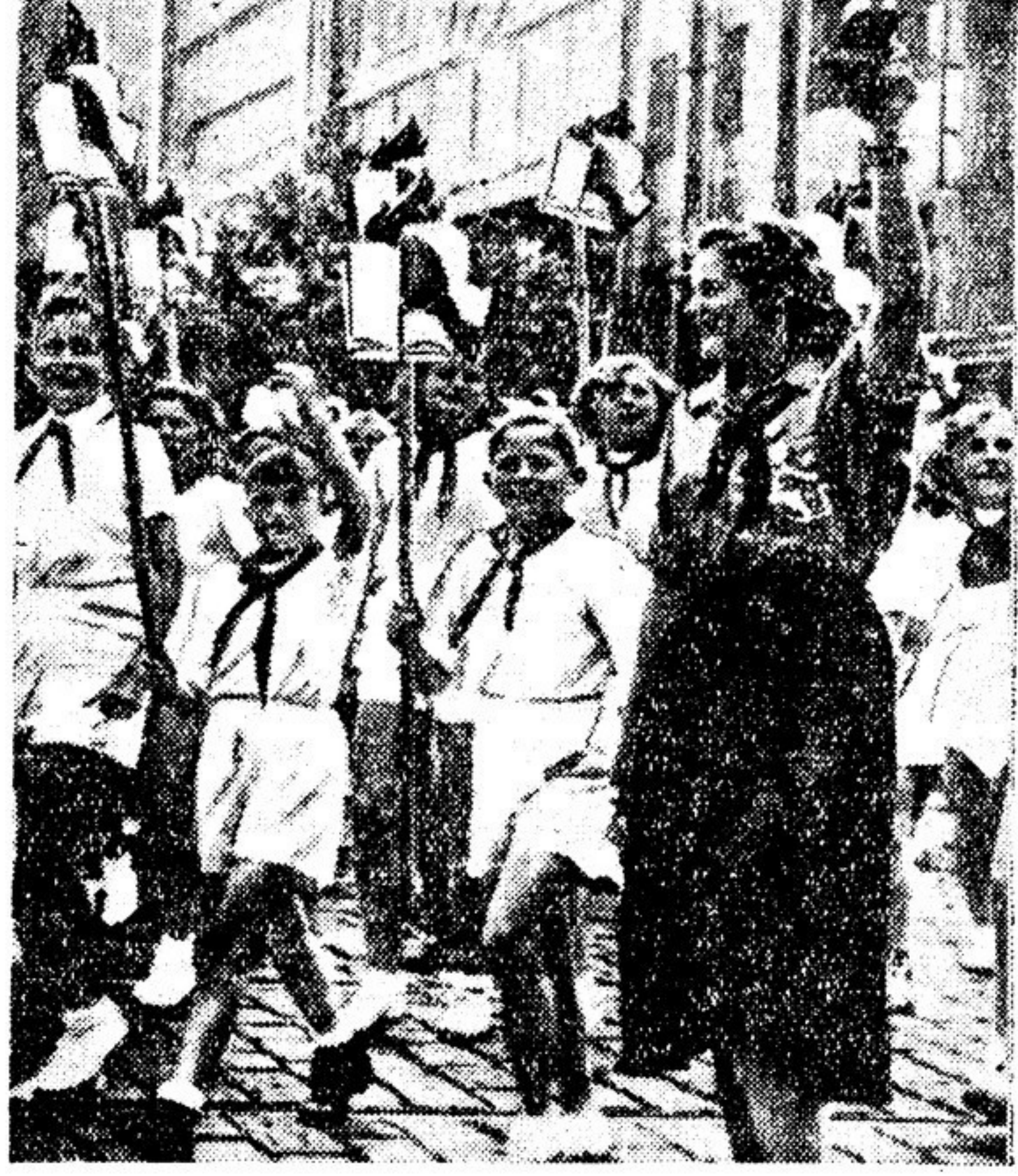
ЧЕХОСЛОВАКИЯ. Пионеры на демонстрации

ДВОРЦЫ ПИОНЕРОВ РУМЫНИЯ. Дети Бухареста хорошо знают этот дом на старом котроенском холме. Величественное здание с широкими террасами и балконами, выходящими в парк, ранее принадлежало румынскому королю. Ныне народ перенес здесь детский дом. И с утра до позднего вечера в его комнатах звучит громкий смех, царит радостное веселье. Что только нет во Дворце пионеров Бухареста! Здесь каждый может найти применение своим наклонностям. Вот из одной комнаты доносится звуки гармоники — там занимается музыкальный кружок. В другой комнате расположились юные авиамоделисты. Тут — скульптурная мастерская, дальше — зал, где у мольбертов занимаются живописцы. Механическая, столярная, слесарная и электротехническая мастерские находятся в полном распоряжении подростков. Увлекающие путешествия совершают по великой советской стране юные географы, собиравшие у карты. С затоем дыханием слушают они рассказы о Москве, о островах коммунизма на Волге, Дону, Днепре, Аму-Дарье. Всегда оживленно и в парке, прилегающем к Дворцу пионеров. Здесь есть театр, в котором дети являются и актерами и зрителями, бассейн для плавания, площадки для игр. Юные мячирыни ухаживают за выращиваемыми ими плодовыми деревьями. В прохладной тени каштанов, среди кустов сирени и роз разместились шахматисты, любители книг. Дворцы пионеров существуют еще в 10 городах Румынии. Значительная часть школьников страны (а их больше двух миллионов) может проводить здесь свой досуг.