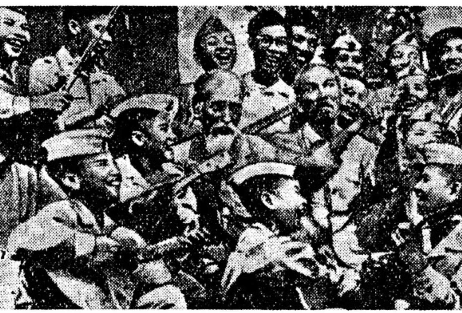
ВЬЕТНАМ. Президент республики Хо Ши Мин в окружении радостной детворы

НОВЫЙ ДОМ — ЭТО ШКОЛА! АЛБАНИЯ. Куда бы вы ни поехали в Албанию, всюду — в ласковых долинах, на побережье Адриатика, в суровых горах Пешкопия и Хоти, в городах и деревнях можно увидеть новые, блистающие свежестью краской, полные света и простора дома — это школы... Все лучшее, что есть в стране, воспрянувшей к новой жизни, отдается детям. Сотни лет турецкого владычества тяжело сказались на культуре албанского народа. В непроглядной тьме держали простых людей Албании и итальянские оккупанты. Накануне освобождения страны в 1944 году из каждых десяти жителей девять не умели ни читать, ни писать. Ныне более чем в двух тысячах начальных школ и двухстах семилетках обучаются 160 тысяч детей. В новых зданиях и бывших монастырях, отапливаемых под школы, приобщаются к знаниям дети нефтяников и пастухов, земледельцев и кузнецов. Для детей, проживающих в далеких горных районах, при школах созданы специальные интернаты, где они живут на полном государственном обеспечении.