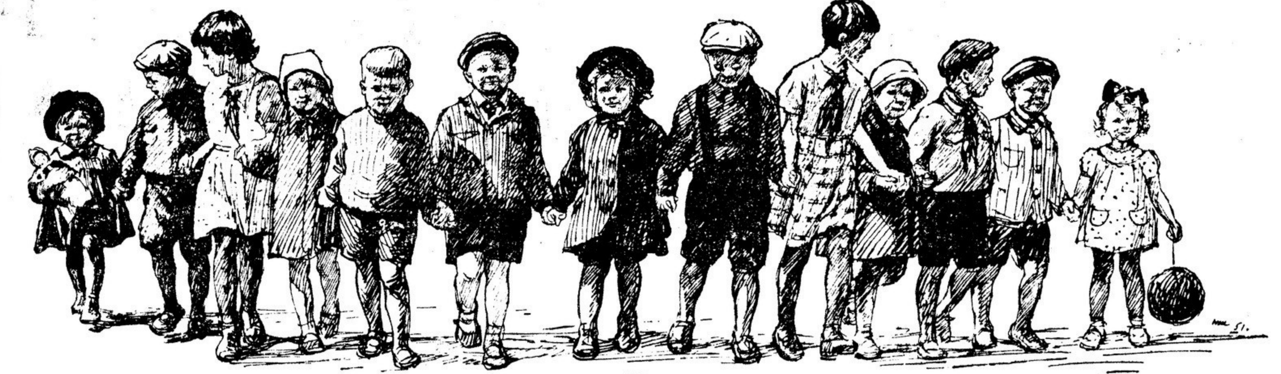
Рис. художника Н. Жунова.

Сидевший рядом со мной пионер потел отвечать, а с залпом карты поплыла маленький выхристый мальчуган. Я сразу же заметил, что он волнуется больше других.