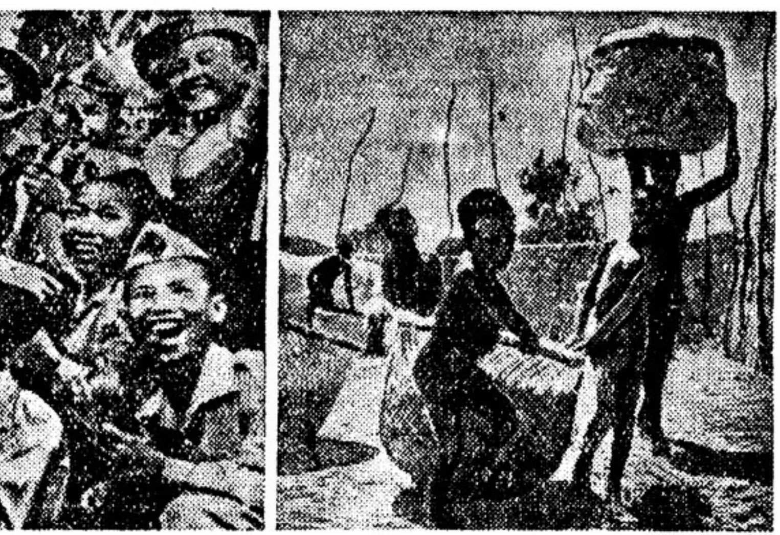
УБАНГИ-ШАРИ (Французская Экваториальная Африка). Юные невольники хлопковых плантаторов

ЛАГЕРИ, САНАТОРИИ, ПЛОЩАДКИ ПОЛЬША. Скоро сотни тысяч польских детей отправятся в пионерские лагеря и санатории, в увлекательные путешествия по стране. У подножья Татр и на побережье Балтийского моря, на живописных берегах рек и озер, в лесной тиши раскинутся многочисленные детские лагеря. Если в 1949 году в летних лагерях и санаториях отдыхало около одного миллиона детей трудящихся Польши, то в нынешнем году количество отдыхающих значительно увеличилось. Правительство отпустило на эти цели четверть миллиарда злотых. Многие дети трудящихся отдыхают в летних лагерях и санаториях бесплатно, за счет государства, другие — оплачивают лишь часть содержания.