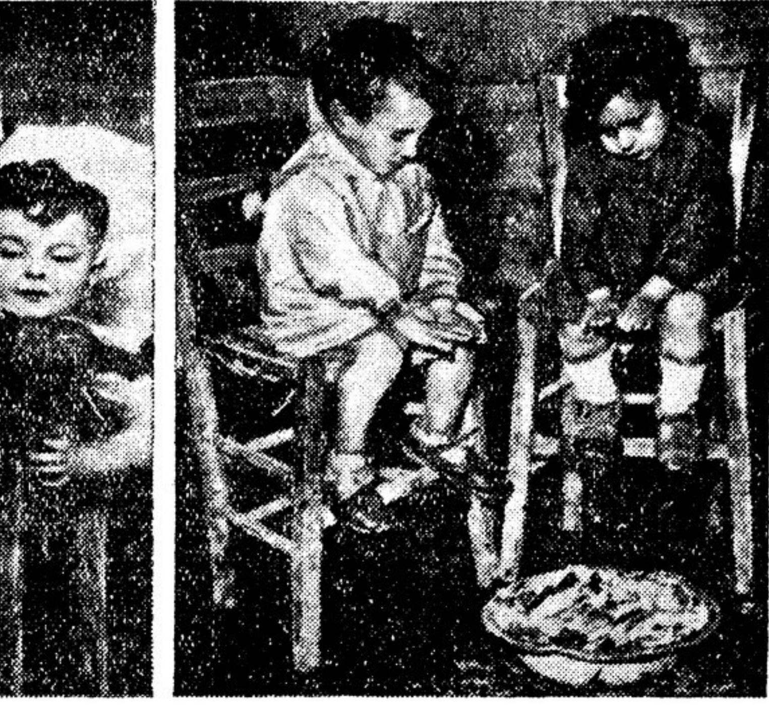
ИТАЛИЯ. Дети, живущие в лачугах Тор Маранча (пригород Рима)

НОВЫЙ ДОМ — ЭТО ШКОЛА! АЛБАНИЯ. Куда бы вы ни поехали в Албанию, всюду — в ласковых долинах, на побережье Адриатика, в суровых горах Пешкопия и Хоти, в городах и деревнях можно увидеть новые, блистающие свежестью краской, полные света и простора дома — это школы... Все лучшее, что есть в стране, воспрянувшей к новой жизни, отдается детям. Сотни лет турецкого владычества тяжело сказались на культуре албанского народа. В непроглядной тьме держали простых людей Албании и итальянские оккупанты. Накануне освобождения страны в 1944 году из каждых десяти жителей девять не умели ни читать, ни писать. Ныне более чем в двух тысячах начальных школ и двухстах семилетках обучаются 160 тысяч детей. В новых зданиях и бывших монастырях, отапливаемых под школы, приобщаются к знаниям дети нефтяников и пастухов, земледельцев и кузнецов. Для детей, проживающих в далеких горных районах, при школах созданы специальные интернаты, где они живут на полном государственном обеспечении.