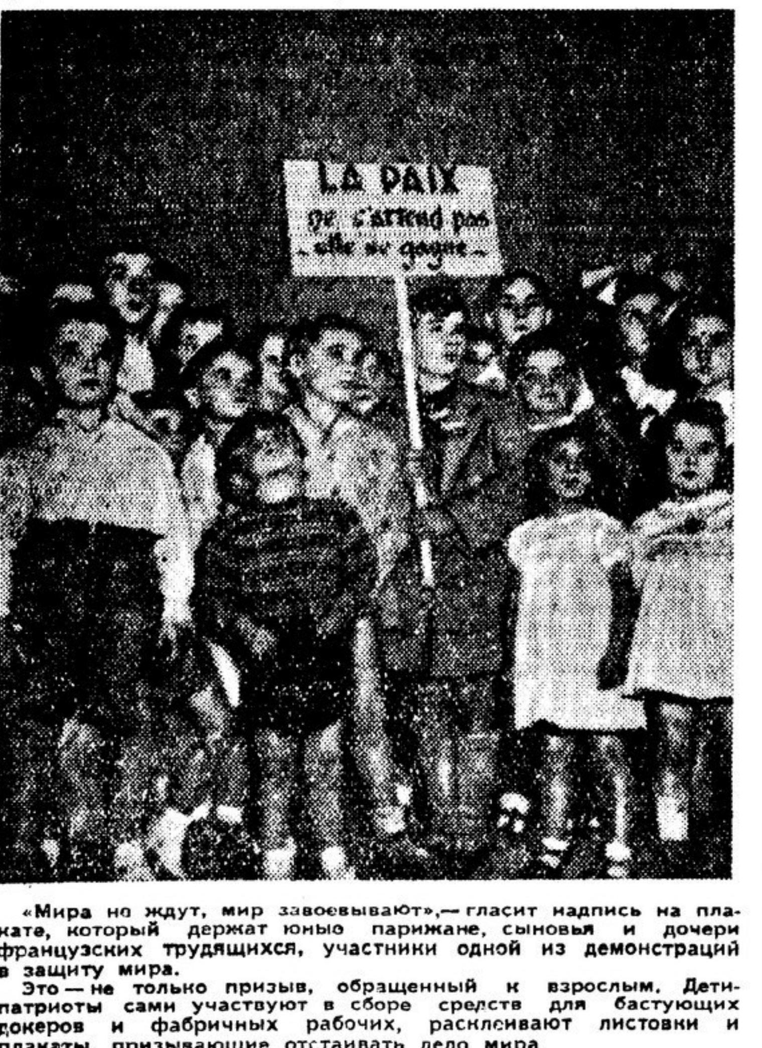
«Мир не ждёт, мир завоевывают», — гласит надпись на плакате, который держат юные парижане, сыновья и дочери французских трудящихся, участники одной из демонстраций в защиту мира.

ОБРЕЧЕННЫЕ НА НИЩЕТУ ЛАТИНСКАЯ АМЕРИКА. Дети трудящихся латиноамериканских стран усиленно «опекаемы» империалистами США, обречены на голод и нищету. По явным преданиям данным, собранным ЮНЕСКО, 19 миллионов детей школьного возраста в странах Латинской Америки лишены возможности посещать школу. В Бразилии учатся лишь 26 процентов, в Бразилии — 31,5 процента, в Эквадоре — 29,3 процента, в Гондурасе — 21,5 процента и т.д. Газета «Эль пинс», сообщая об ужасном состоянии школ в Уругвае, пишет: «Всюду в стране, куда бы ни обратились наши взоры, мы видим такую же картину».